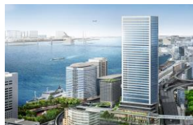
Left: Main Building Right: Satellite Office