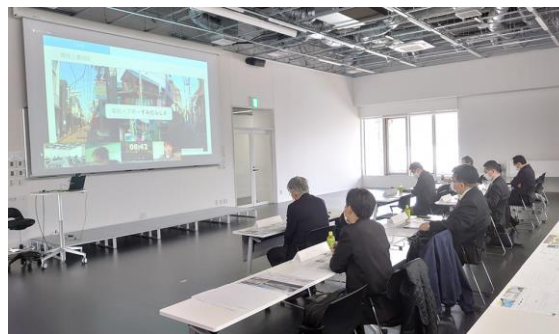
◀ The final screening