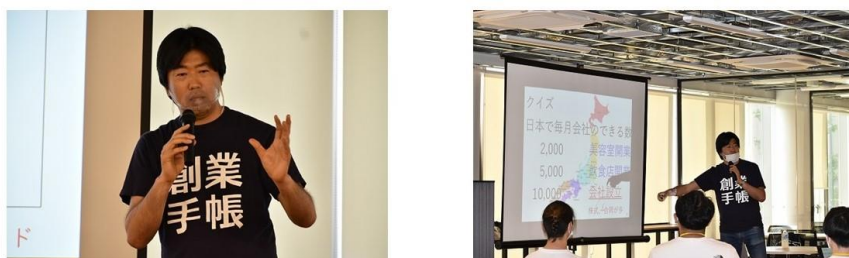
▲インキュベーションサロン開設記念イベントの様子。

iU では、学生の起業支援のハブ機能を担う iU インキュベーションサロンを学内に設置しました。第 1 回開設記念イベントとして、創業手帳代表取締役の大久保幸世氏（iU 客員教員）をお招きしたイベントを 6/9（水）に実施しました。イベントでは大久保幸世氏が起業を志す学生向けに特別講演を行いました。今後、インキュベーションサロンでは、起業支援に関するイベントや講座等を実施することで、起業支援を推進してまいります。