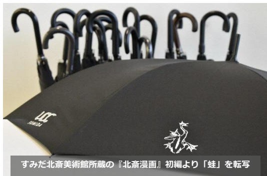
すみだ北斎美術館所蔵の『北斎漫画』初編より『蛙』を転写