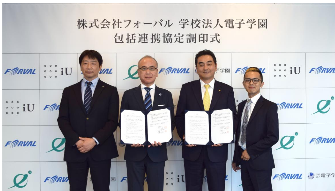
▲6月6日（月）学校法人電子学園で実施された包括連携協定調印式の模様