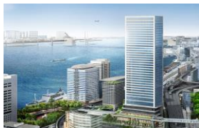
左：本校舎 右：サテライトオフィス