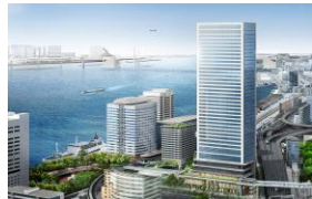
左：本校舎 右：サテライトオフィス