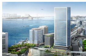
左：本校舎 右：サテライトオフィス