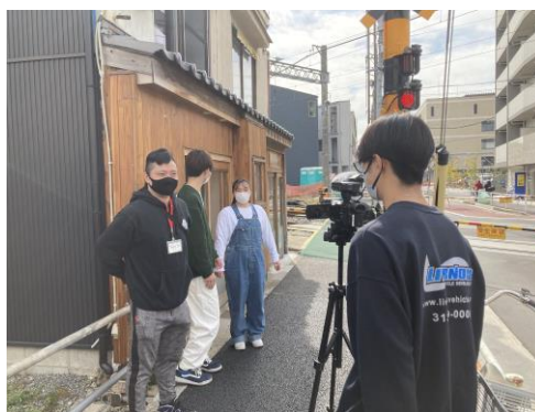
▲ ロケを実践する学生