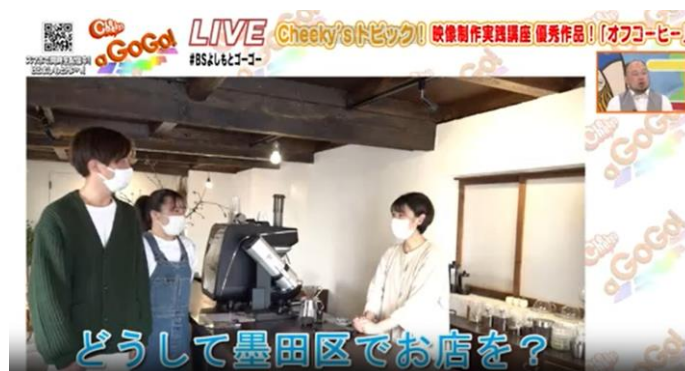
▲ BS よしもとで放送された学生が制作した映像