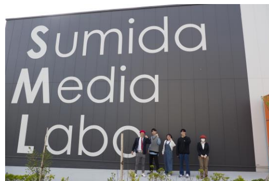
▲すみだメディアラボでの集合写真