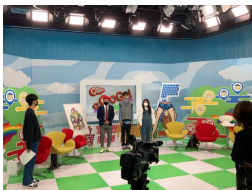
▲ 生放送のリハーサルを行う学生と講師