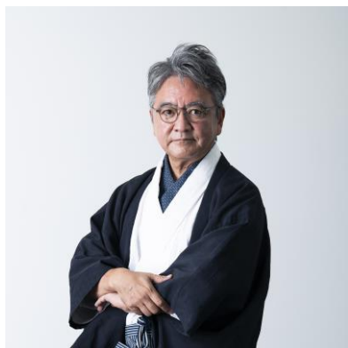
iU 学長 中村 伊知哉

iU は、情報つまり ICT、経営つまりビジネスで、イノベーションを起こすプロ、革新をつくる専門職を生み出す大学として、2020 年 4 月に開学し、この春に、第 1 期生が初の卒業を迎えました。今回、この第 1 期生である卒業生らが中心となり、在学生とともに、DAO の取り組みをはじめてくれました。いち早く行動を起こし、チャレンジしていく彼らと DAO を応援し、一緒にさらに魅力ある大学はもちろん、コミュニティ創りを目指します。