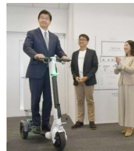
区長が乗車体験した際の様子 （令和5年11月撮影）

https://prtimes.jp/main/html/rd/p/000000043.000102850.html